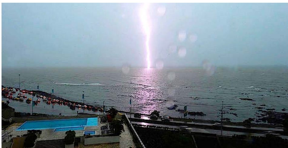
Figure 2. Panama. Éclair sur l’océan Pacifique